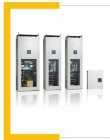
Filtros de armónicas