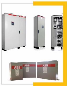
Bancos de Capacitores Fijos y Automáticos