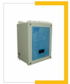
Supresores de picos